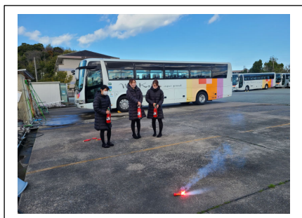
< 発煙筒 >