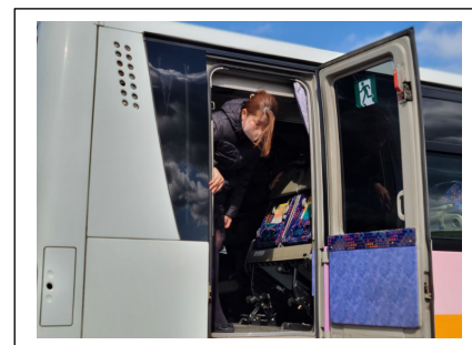
< 非常扉 >