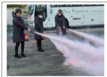
< 消火器 >